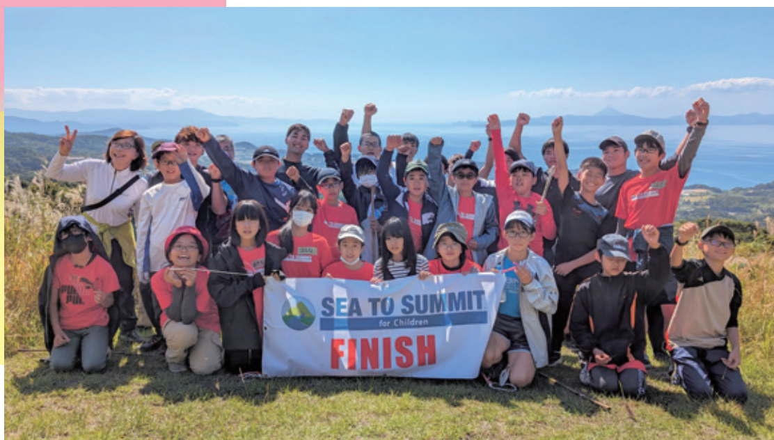
【大隅】SEA TO SUMMIT for Children