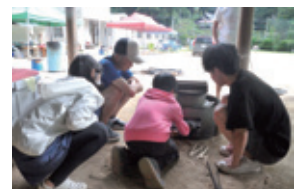
7泊8日のゆったりした時間の中で ～心を育むどんぐりキャンプ～