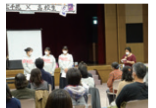
びわこビブリオ道場 2022 秋の風