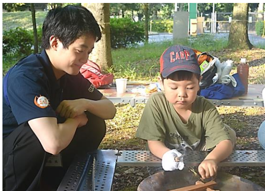
<教育事業の補助の様子>