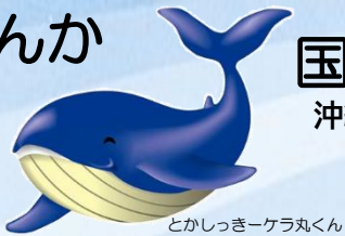
とかしきーケラ丸くん