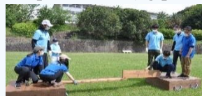
【アドベンチャーラリー】