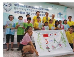
作成した絵本の発表会 (日中韓子ども童話交流事業)