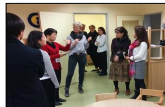
訪問先での意見交換

ドイツから日本に派遣された2023年度団員との意見交換を通して、研修で学んだことを整理します。