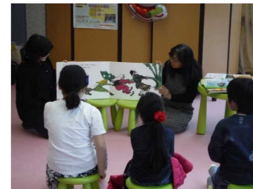
「えほんおはなし会」