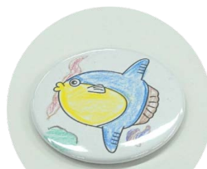
ぬりえで彩るオリジナル缶マグネット