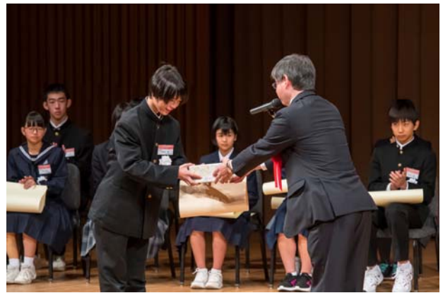
表彰式では、全国大会発表者全員に奨励賞賞状及び記念品、 四賞を受賞した方には、各賞の賞状及び記念の盾が贈られました。