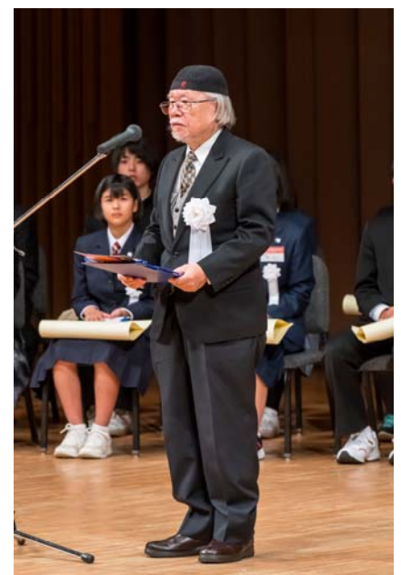
漫画家の松本零士審査委員長より、 審査委員会委員長賞の賞状授与及び 講評をいただきました。