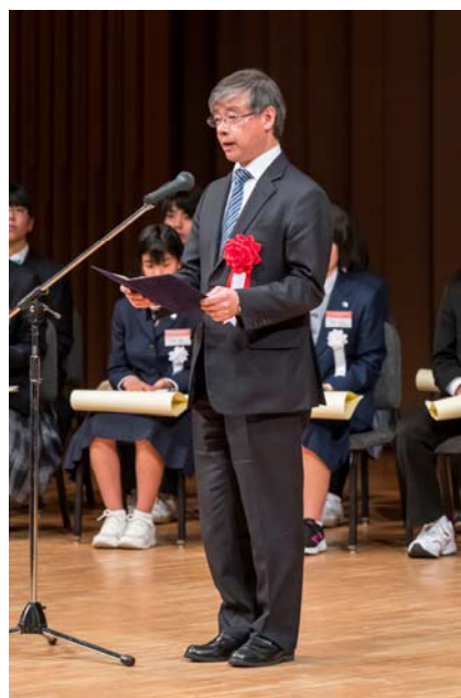
文部科学省の常盤生涯学習政策局長 より、文部科学大臣賞の賞状授与及 びお祝いのお言葉をいただきました。