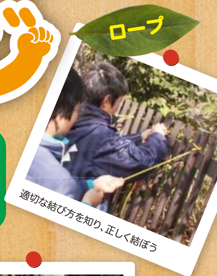
適切な結び方を知り、正しく結ぼう