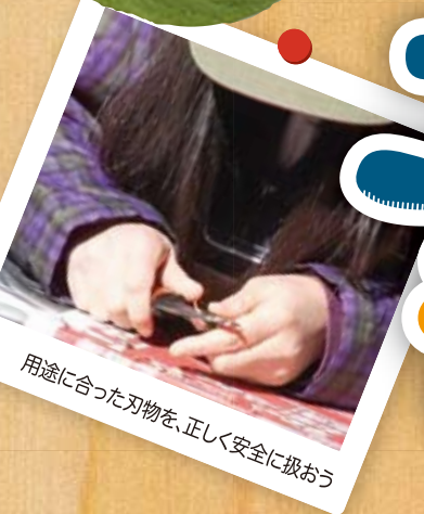
用途に合った刃物を、正しく安全に扱おう