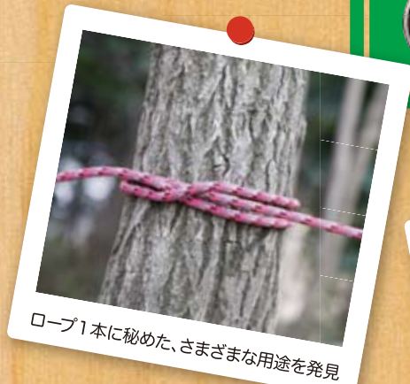
ロープ1本に秘めた、さまざまな用途を発見