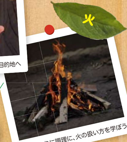
暖に明かりに調理に、火の扱い方を学ぼう