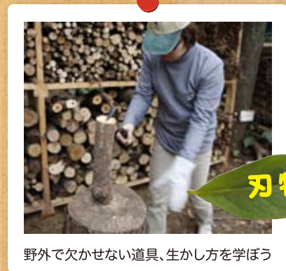
野外で欠かせない道具、生かし方を学ぼう

平成24年 1月8日(日) / 2月26日(日) 国立オリンピック記念青少年総合センター