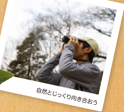
自然とじっくり向き合おう