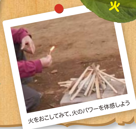
火をおこしてみ、火のパワーを体感しよう